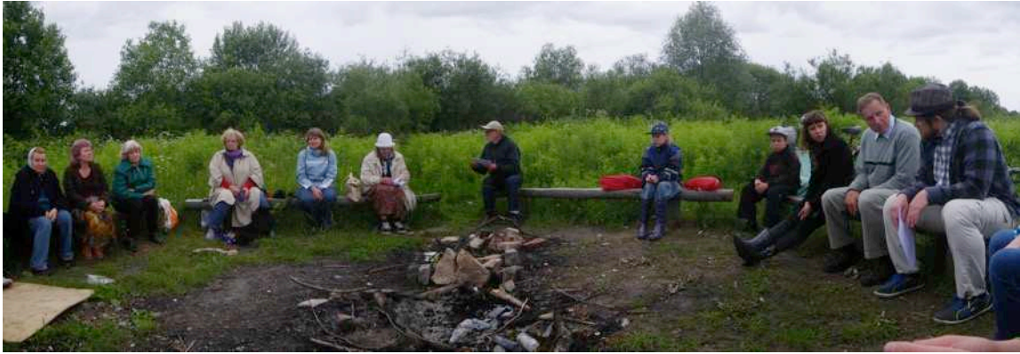
Pildil maheaednikud Lehe tänava aiamaa lõkkeplatsil.