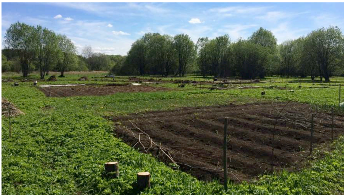
Pildil Mõisavahe maheaed.

Aprillis toimus maakasutuse inventuur ning uute maatükkide välja jagamine ja aiandushooaja alustamine. Esimest aastat algas täismahus aiandustegevus Mõisavahe aias, samuti saime linnalt juurde maad Lehe tänava piirkonnas.