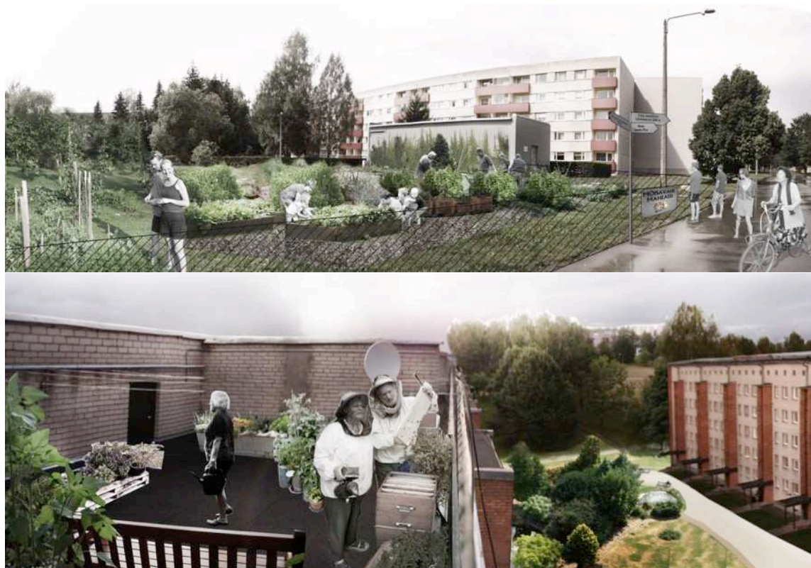
Piltidel illustratsioonid tööst "Anne Aedlinn".

konsultatsioonidel osalemist ka 2015 aastal ning on partner konkursi korraldajatele ja Tartu linnale linnaiaanduse visiooni arendamisel ja ellu viimisel.